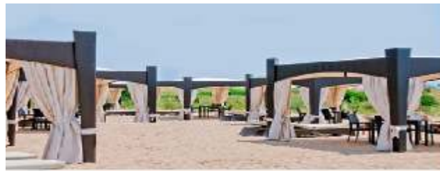
"I Mercanti del Mediterraneo"

Le strutture espositive messe a disposizione in locazione ad artigiani, commercianti locali si rifanno ad una architettura tipica delle costruzioni mediterranee. Lo stile Moresco, nelle sue forme essenziali che richiamano la cultura araba, offrono una dimensione affascinante ai visitatori i quali potranno provare l'emozione di fare acquisti nelle "Medine" delle più famose località turistiche. Il mercato tipico del Mediterraneo ricco di colori e profumi delle spezie orientali, i tessuti damascati, i frutti esotici, i prodotti dell'artigianato locale. L'organizzazione metterà a disposizione tutte le strutture necessarie per l'allestimento della zona destinata ai "Mercanti del Mediterraneo" curando in particolare una situazione scenografica di luci e ambienti di sicura attrazione.