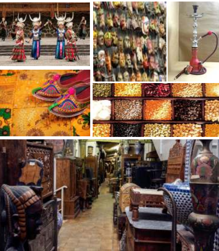
Una tipica sala sarà allestita per il piacere di degustare il vero Thé Verde o i vari infusi aromatici preziosi nella medicina alternativa in totale relax.